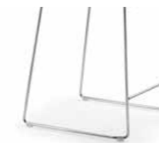
Base a slitta sgabello basso cromata Chromed lower sled stool base Pièt. Bas luge tabouret chromé Hocker Kufengestell, niedrig, verchromt